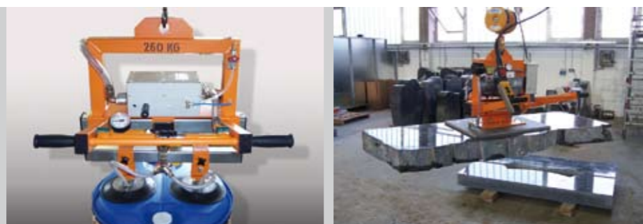
vľavo: Premiestňovanie sudov v nevýbušnom prostredí 260 kg