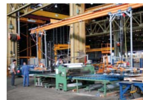
vpravo: Premiestňovanie betónových prefabrikátov s formou i bez formy 6.000 kg 2.500 x 6.800 mm