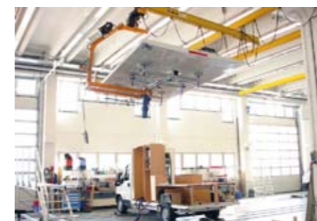
vpravo: Zdvíhacie zariadenie pre žeriav 3.800 kg 3.000 x 16.000 mm