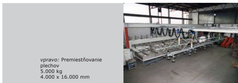
vpravo: Premiestňovanie plechov 5.000 kg 4.000 x 16.000 mm

Nasledujúce obrázky prinášajú malý výber realizovaných špeciálnych riešení