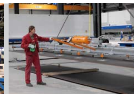
vľavo: Kompletné podávacie zariadenie s 2 vákuovými manipulátormi (zakladanie a vyberanie) s pevným vedením bremana à 500 kg 1.500 x 3.000 mm